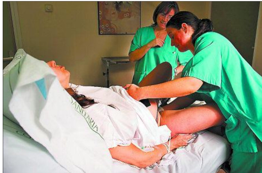
Monitorización durante la dilatación de un parto natural en la Maternidad.

Datos del Instituto Municipal de Asistencia Sanitaria (IMAS) de Barcelona señalan que el coste de un parto normal sin complicaciones es de 1.940 euros, mientras que el de una cesárea supone 2.950 euros. El jefe de Ginecología y Obstetricia del hospital La Inmaculada de Huércal-Overa (Almería), Longinos Aceituno, no tiene cifras exactas, pero pone ejemplos: "Con el parto poco intervenido, se usa menos analgesia epidural, se hacen menos episiotomías y se realizan menos partos instrumentales. Se ahorra el tiempo del anestesista, la intervención del ginecólogo y, aunque es verdad que se aconseja que haya una matrona por mujer, son menos imprescindibles que cuando deben controlar la epidural y asistir el parto instrumental con el ginecólogo".