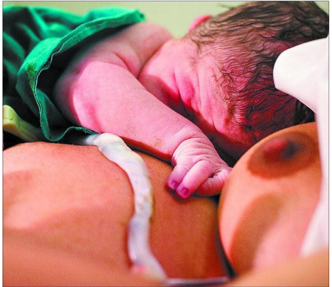
Un bebe recién nacido en una clínica de partos naturales con su madre.

Mirándolo globalmente, la donación autóloga lastra el beneficio de la comunidad, incluyendo a los propios niños cuyos padres han preferido depositar su cordón en un banco privado. En caso de necesitar un trasplante, estos niños verán mermadas sus